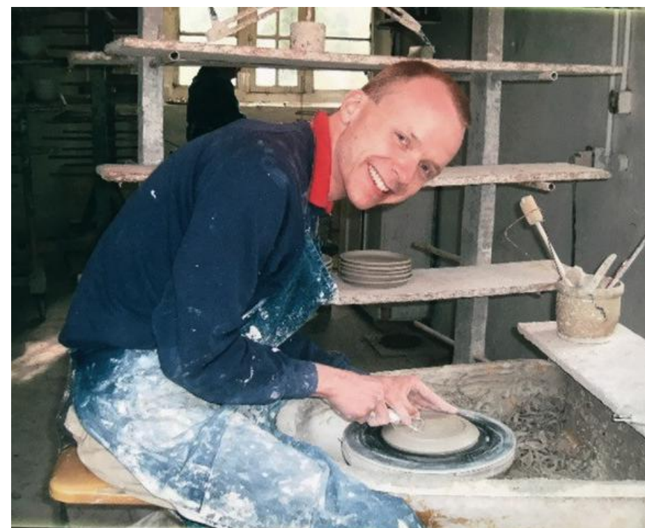
Keramiker: Keramikerverkstedet i Mount Saint Bernard, hvor han arbeidet i noen år.