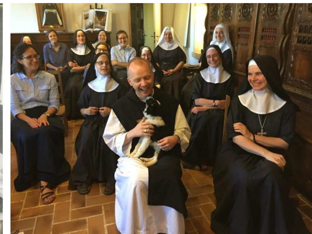
Sabbatsperioden: Boulaur, klosteret i Frankrike, hvor han tilbrakte sabbatsperioden. Her sammen med klosterets nonner og klosterets Border Collie.